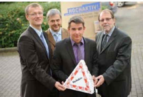
Round-Table-Gespräch in Herne

Den Crohn & Colitis-Tag 2010 veranstaltete das Kompetenznetz-CED in diesem Jahr erneut gemeinsam mit der DCCV. Mit fast 100 Terminen unter dem Dach des Crohn & Colitis-Tages freuten sich die Veranstalter und Sponsoren wieder über eine hohe Resonanz. Mit den bekannten Informationspaketen wurden circa 40 Arzt-Patient-Seminare, 45 Praxen/Ambulanzen und Selbsthilfegruppen, die Pressekonferenz auf der DGVS und mehrere Round-Table-Gespräche beliefert. Danke an alle, die den Crohn & Colitis-Tag genutzt haben, um die breite Öffentlichkeit über ein Thema zu informieren, dass trotz 320.000 Betroffenen weiterhin ein Schattendasein führt.